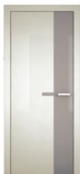
Pearl Grigio fumè