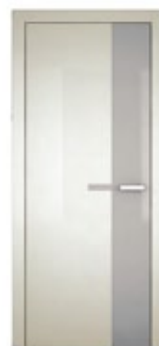
Pearl Grigio seta